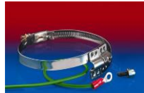
CLAMP 212 EC