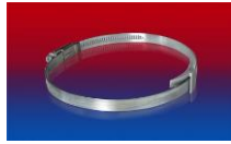
CLAMP 210 BRIDGE CLAMP